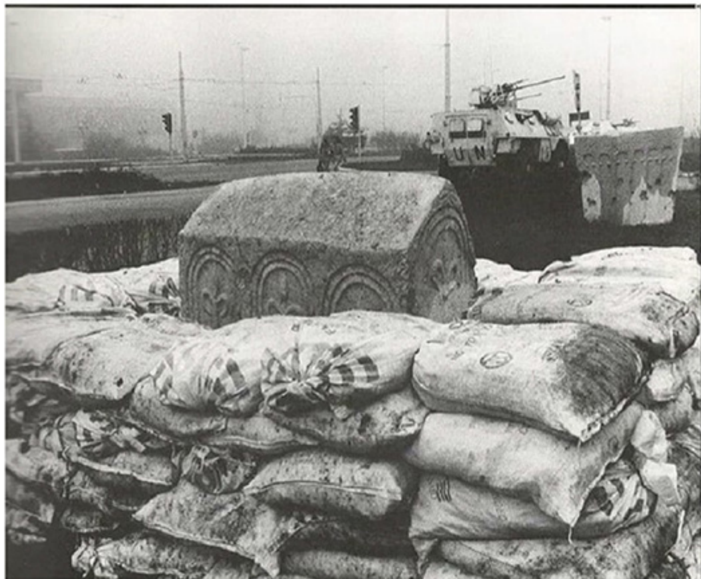
Stećak za vrijeme rata u BiH, ispred Zemaljskog muzeja u Sarajevu, je bio zaštićen vrećama s pijeskom. Dan danas je na istoj lokaciji.